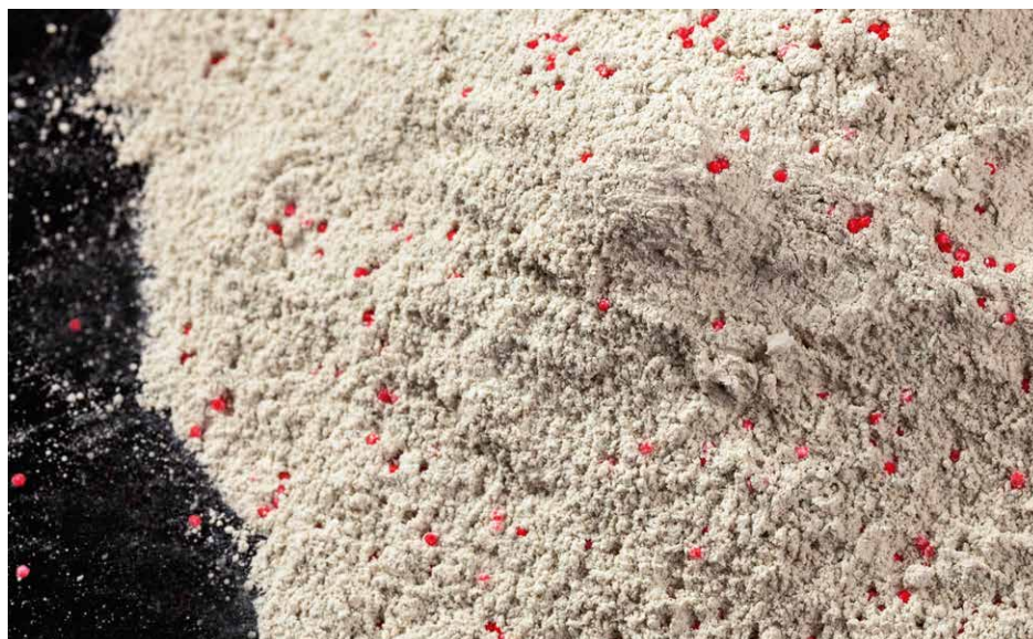
1 Probiotische Schutzkulturen (rot) im Hygienepulver

ProfiStreu LB und ProfiDry LB sorgen für ein trockenes und angenehmes Stallklima.